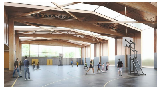
Élèves scolarisés dans l'établissement